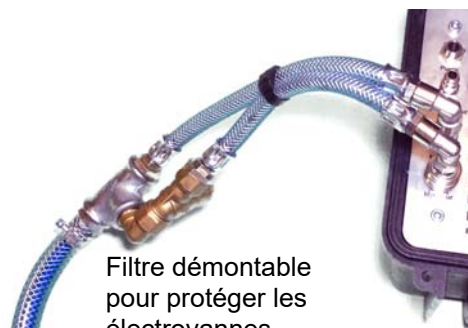
Filtre démontable pour protéger les électrovannes