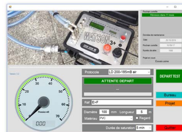
Logiciel graphique avec création de dossiers PDF