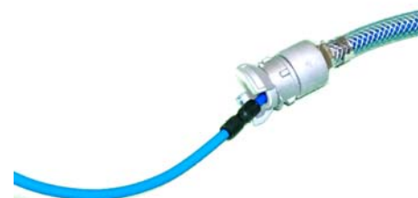
Injecteur double chambre 16mm Plus de souplesse et un seul tuyau