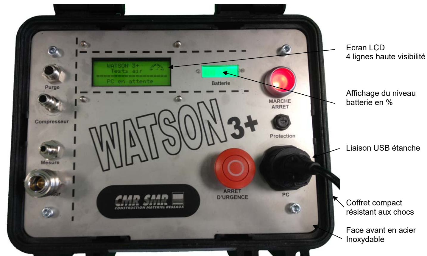
Ecran LCD 4 lignes haute visibilité