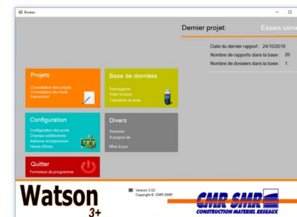
Version bureau intégrée