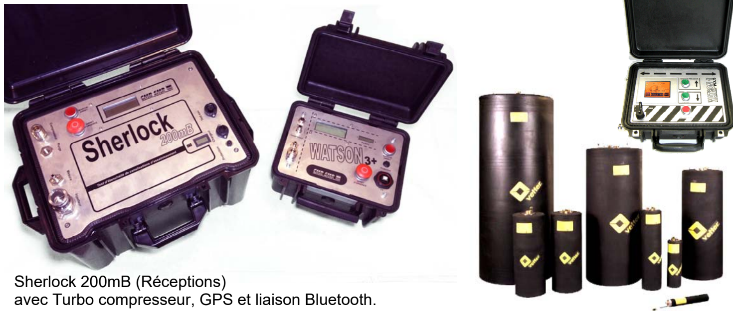
Sherlock 200mB (Réceptions) avec Turbo compresseur, GPS et liaison Bluetooth.

Découvrez également notre gamme d'obturateurs, d'appareils d'autocontrôle et Sherlock 200