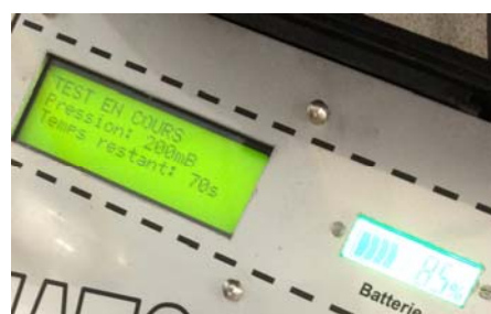
Ecran LCD visible en plein soleil

Visualisez le temps, la pression, la phase de test en cours sans avoir à revenir au véhicule.