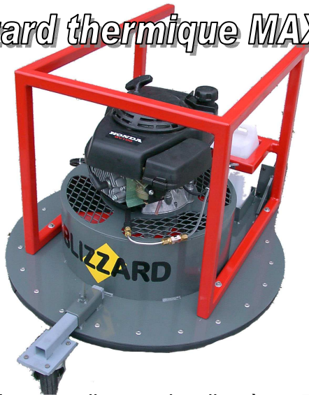
Blizzard thermique MAXI

Équipé de son disque de diamètre 750mm, adapté à tous les regards, le BLIZZARD thermique permet de générer et d'injecter une épaisse fumée dans les canalisations d'assainissement (Séparation eaux usées et eaux pluviales).