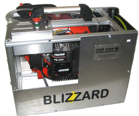
Blizzard thermique FLEX

Ce système compact et portable, permet d'injecter par sa gaine flexible une épaisse fumée à très haute vitesse dans les ouvrages difficiles d'accès.